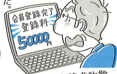
架空料金請求詐欺